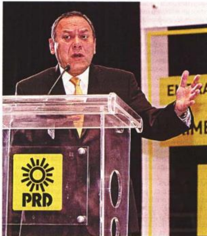
JESÚS ZAMBRANO GRIJALVA Presidente nacional del PRD

"Nuestra alianza entre partidos [PRD, PAN y PRI] es un acuerdo transdirigentes, es decir, trasciende a los dirigentes [de los institutos políticos]"