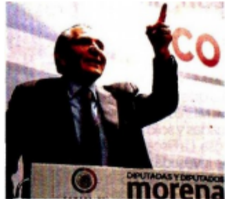
EN SAN LÁZARO. “El PRI fue quien buscó consenso en el tema de la GN”, dijo.