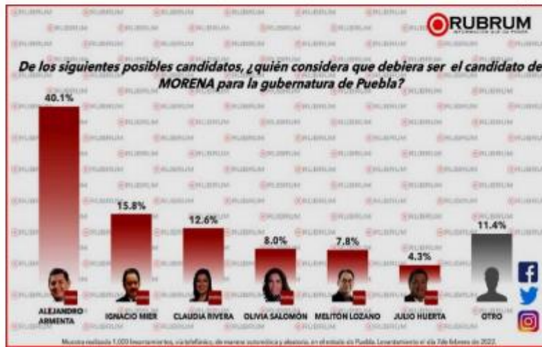
El candidato de Morena tendría el 48% de los votantes.