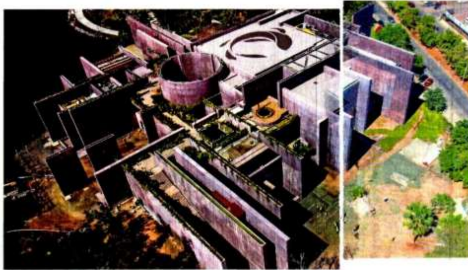
El Acuario Mar de Cortés se construye bajo un esquema público y privado.