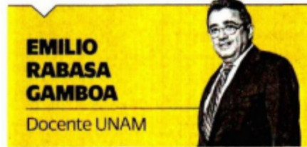
EMILIO RABASA GAMBOA