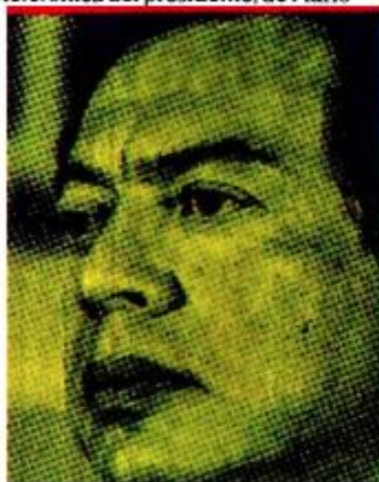
MARIO DELGADO DIRIGENTE NACIONAL DE MORENA