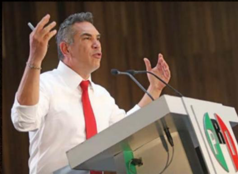
Alejandro 'Alito' Moreno, presidente nacional del Partido Revolucionario Institucional.

El valor político que representa el partido Movimiento Ciudadano podría ser la clave para vencer a Morena en las próximas elecciones, sin embargo, primero deben lograr convencerlo de que se les una