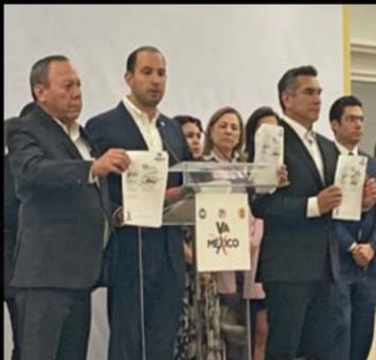
La Coalición Va Por México, conformada por el PAN, PRI y PRD surgió para competir en los comicios de 2021.

"Depende primero de la legitimidad interna de los presidentes de los partidos para poder ser la voz cantante de la coalición,