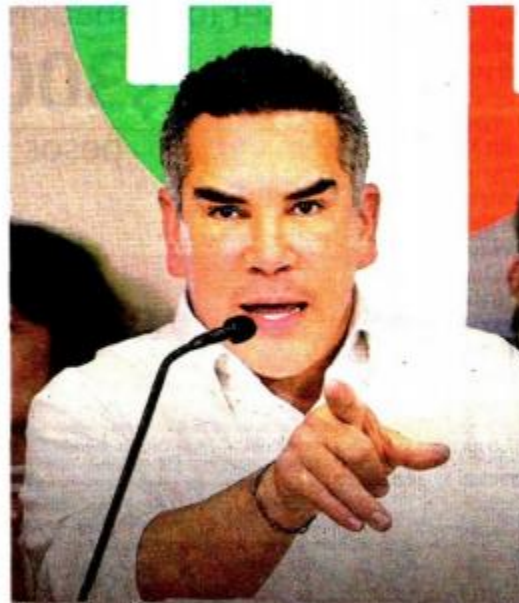
ALEJANDRO MORENO Presidente nacional del PRI

"Si quisiéramos reformar solo las leyes secundarias, no necesitaríamos de otros grupos parlamentarios"