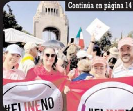
Ciudad de México