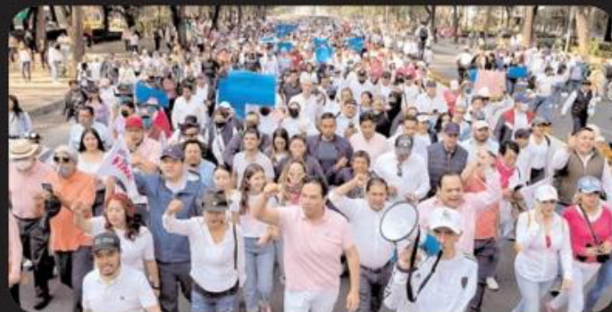
Estado de México