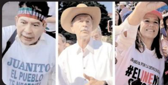
Rafael Acosta "Juanito", Vicente Fox y Margarita Zavala

lución Democrática (PRD), se agruparon ayer por la mañana en el Ángel de la Independencia de la capital mexicana y marcharon hacia el Monumento a la Revolución en defensa, tal como lo indicaba la convocatoria, del Instituto Nacional Electoral (INE).