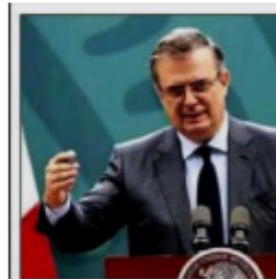
Marcelo Ebrard, informó sobre el término de las restricciones migratorias por el llamado Título 42

No hay que olvidar que las autoridades estadounidenses han enfatizado que no se abrirán sus fronteras y que repatriarán o enviarán a otras naciones, en particular a México, a quienes intenten entrar como indocumentados.