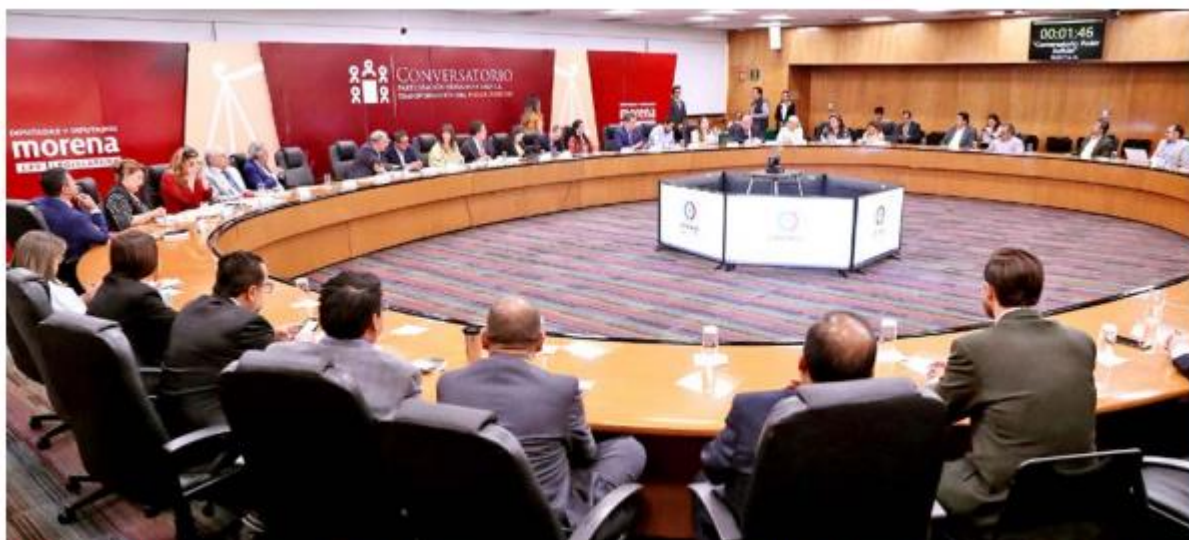
DEBATE. En la Cámara de Diputados se realizan los conversatorios sobre la consulta popular de la elección de ministros de la SCJN, organizados por el grupo parlamentario de Morena.