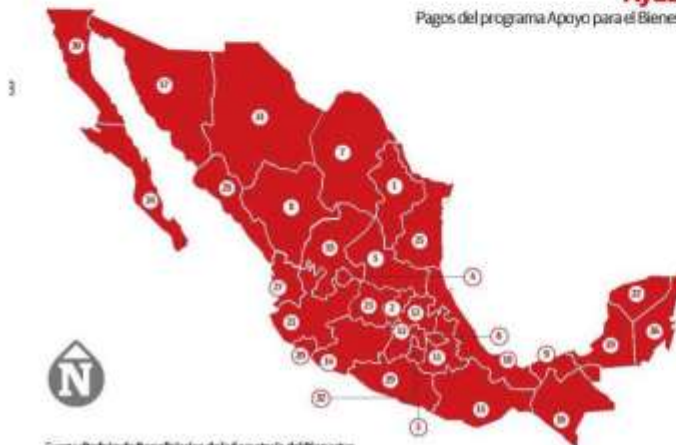
Pagos del programa Apoyo para el Bienestar de las Niñas y Niños, Hijos de Madres Trabajadoras.