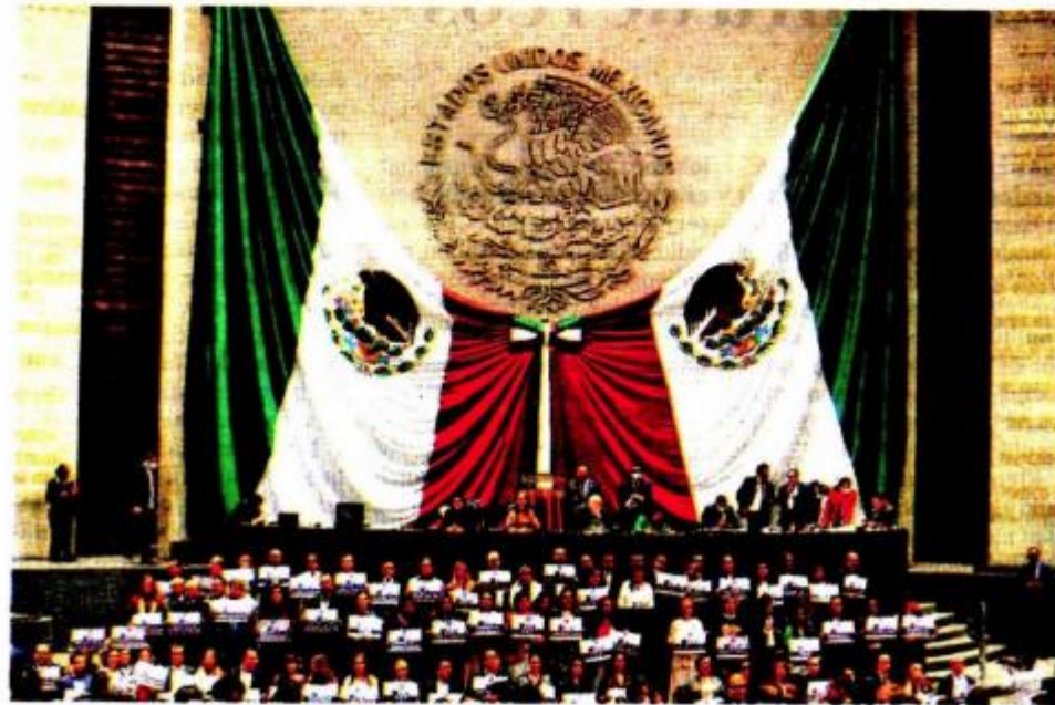
Protesta de panistas contra la "militarización" del país. OCTAVIO HOYOS

• FUENTE: Cámara de Diputados • GRÁFICO: Juan Carlos Fleicer