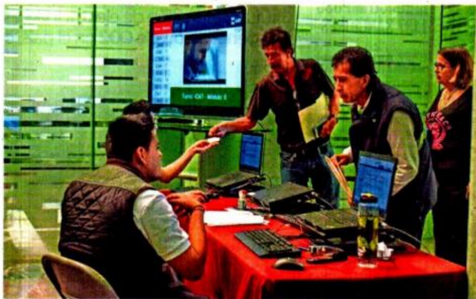
El Servicio de Administración Tributaria recordó en su informe que en este año el plazo para presentar la declaración de personas físicas se amplió hasta el 2 de mayo, por caer el 30 de abril en día inhábil.