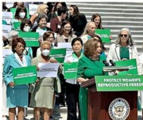
Vestidas de verde, un grupo de congresistas demócratas lideradas por Pelosi defendió el derecho al aborto.

Incluso ayer los legisladores republicanos se pronunciaron enérgicamente en contra de los proyectos de ley, elogiaron la decisión de la