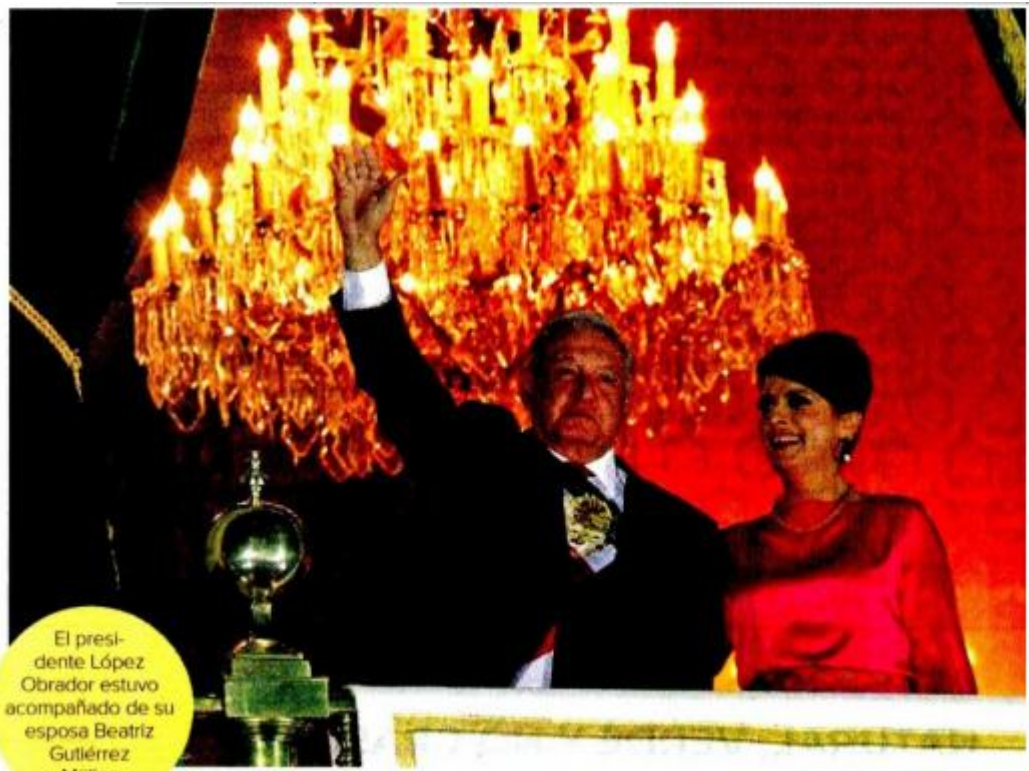
El presidente López Obrador estuvo acompañado de su esposa Beatriz Gutiérrez Müller.