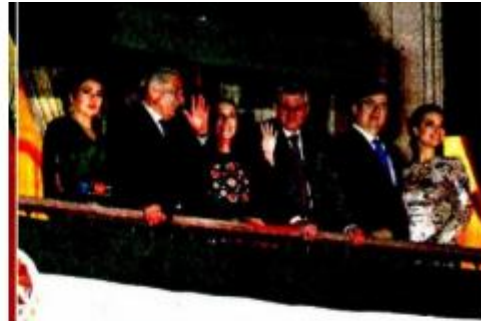
Las corcholatas Adán Augusto López, Claudia Sheinbaum y Marcelo Ebrard disfrutaron juntos.

Hasta el Zócalo capitalino llegaron miles de personas con carteles a favor del presidente Andrés Manuel López Obrador, quienes lanzaron porras y realizaron cánticos de apoyo a la Cuarta Transformación.