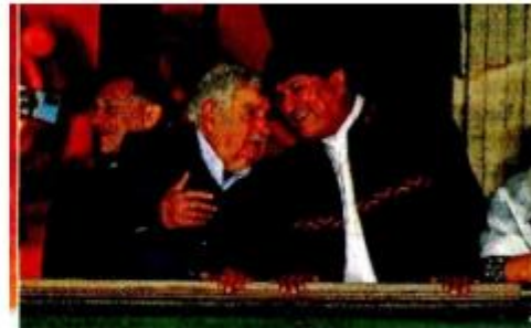
José Mujica y Evo Morales, expresidentes de Uruguay y Bolivia, acudieron a Palacio Nacional.