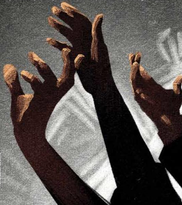
Morena y sus aliados podrían no alcanzar la mayoría simple si los legisladores afines a Ebrard no los apoyan en la aprobación del presupuesto.