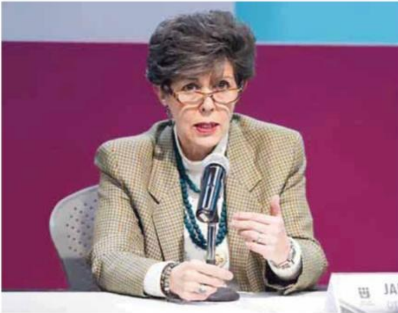
Otálora | "Procesos de partido, simulación para evadir la ley".

"La ley electoral aprobada en 2007 y ratificada en 2017 ha quedado obsoleta y rebasada".