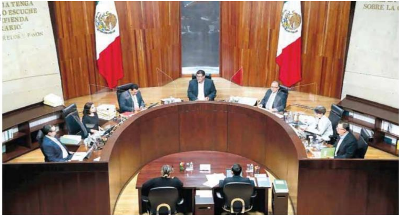
Posturas encontradas de magistrados.

a lo largo de todo el país, promoción en las bardas y calcomanías en cientos de unidades de transporte colectivo en varias entidades del país.