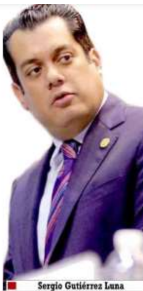
Sergio Gutiérrez Luna