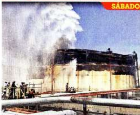
FUEGO EN PEMEX. Un incendio en un tanque de la refinería en Salina de Cruz se reactivó ayer lo que provocó llamas de hasta 70 metros de altura.