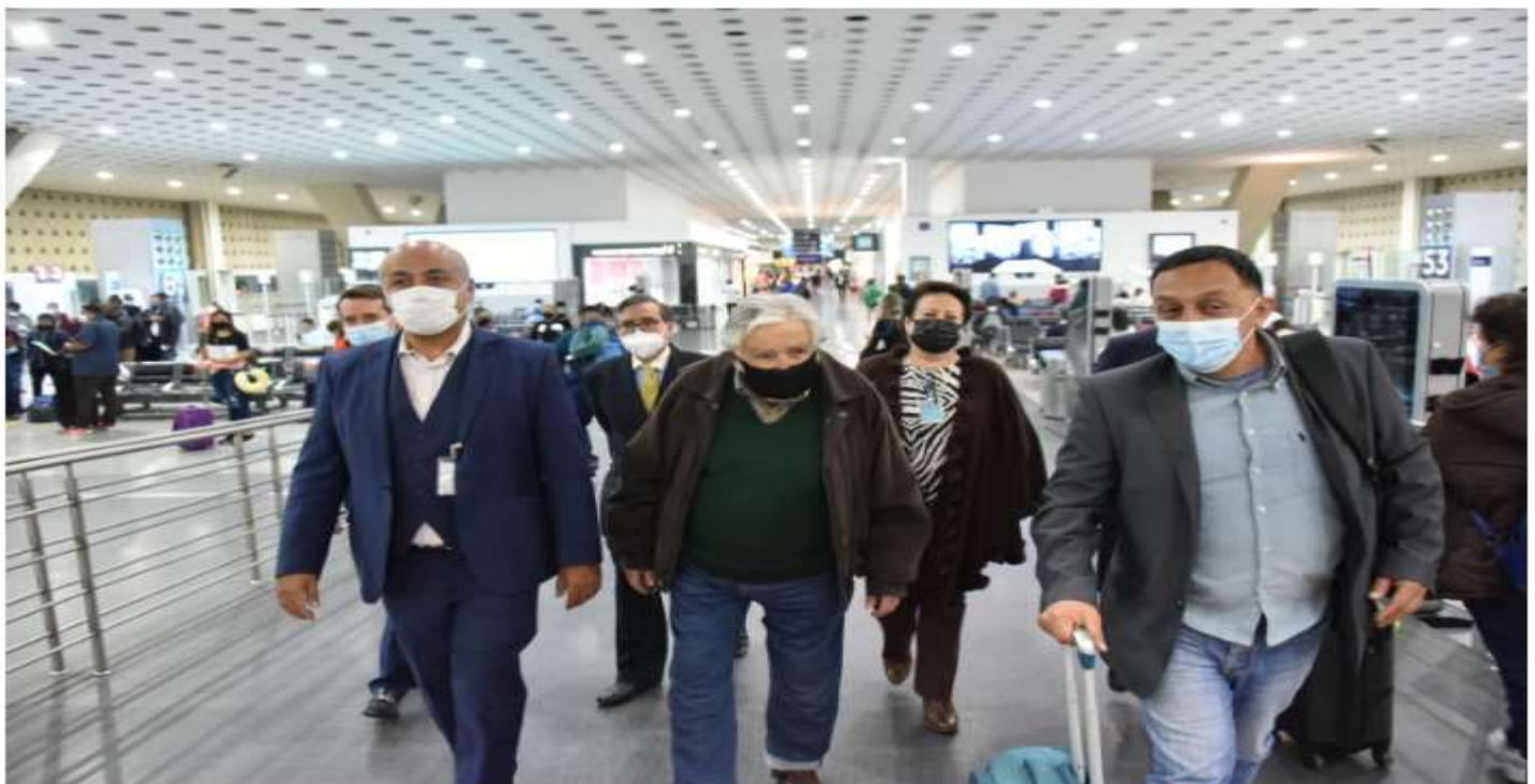
José Mujica fue uno de los invitados internacionales de AMLO El paso de José Mujica por México

El desfile de este año estuvo protagonizado por la Guardia Nacional, organismo que recientemente ha sido integrado a la Secretaría de Defensa Nacional (Sedena) bajo las críticas de la militancia del PAN y otros partidos opositores a la militarización.