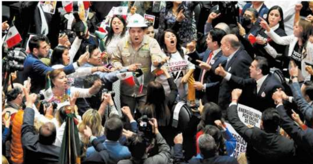
Los diputados de Morena se enfrentaron a los del PRI en el arranque del debate, que alcanzó una asistencia inusual de 498 legisladores.

ción" y envió la iniciativa para reformar la Ley Minera, que busca establecer la propiedad estatal del litio y no requiere una reforma constitucional por las dos terceras partes de los legisladores.