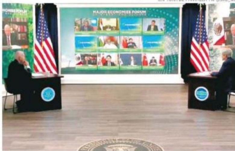
Intervención de Andrés Manuel López Obrador en el foro

Presume que en el programa de reforestación de Sembrando Vida, participan 420 mil campesinos y se plantan un millón de hectáreas con árboles frutales y maderables