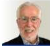
POR RAFAEL ABASCAL Y MACÍAS RABASCAL@1 @RAZAMAL.COM @RABASCAL