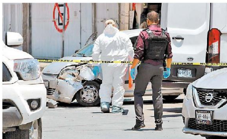
Presentación del líder criminal tras su captura en agosto de 2020 y ataque contra el hijo del alcalde de Villagrán.