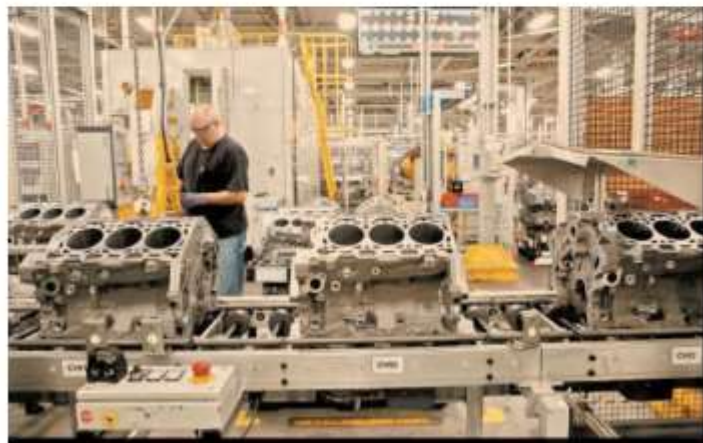
Las empresas manufactureras, como las fabricantes de autopartes, entre otras, habrían sido afectadas de aprobarse la reforma al sector eléctrico.