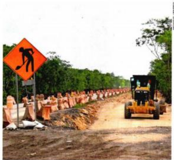
En el marco del aval a la eliminación de los fideicomisos en el Congreso de la Unión, el Presidente aseguró que ese dinero no se usaría para el Tren Maya.