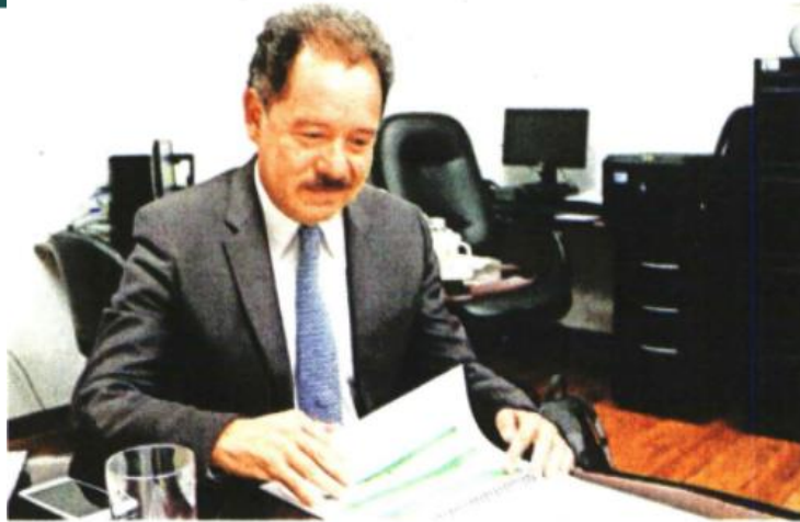
Ignacio Mier, líder de Morena en San Lázaro, publicó que se quedará en México para atender la agenda legislativa e ir a la marcha.