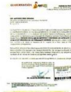
Texto señala modificaciones que exceden lo dispuesto en la Constitución, argumentan.