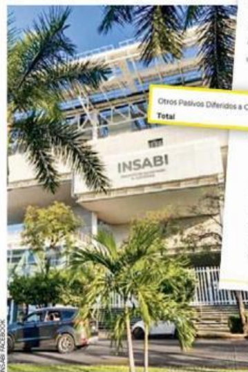
¿Y AHORA? En marzo pasado, se informó que el Insabi amplió sus oficinas en el puerto de Acapulco... Un mes después se extinguió.

que la información financiera del Insabi dé más detalles de las transacciones con la Unops, se le dará más transparencia al proceso de rendición de cuentas para efectos de la Cuenta Pública 2022".