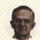
MIGUEL ÁNGEL MANCERA Exjefe de Gobierno de la Ciudad de México

"[No renunciaré] lo que sí voy a hacer (...) es que si a mí no me favorece el resultado voy a apoyar a quien resulte [ganador]"