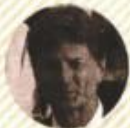
ENRIQUE DE LA MADRID Exsecretario de Turismo

"Yo ya tomé la decisión de estar en la primera línea de defensa de mi país y es exactamente lo que voy a hacer"