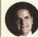
SILVANO AUREOLES Exgobernador de Michoacán

"Voy a seguir hasta el final (...) falta que vayamos a los debates para que la gente sepa lo que cada quien trae en la cabeza"