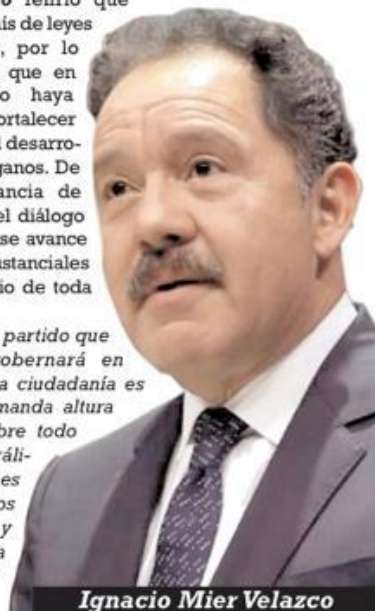
Ignacio Mier Velazco

"Más allá del partido que gobierna o gobernará en algunos años, la ciudadanía es la que nos demanda altura de miras y sobre todo que no haya parálisis entre quienes fuimos electos para cumplir y hacer cumplir la ley", manifestó.