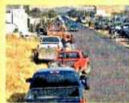
MAR 5. Una caravana de desplazados regresa a sus casas en las comunidades de Cieneguitas de Fernández y Guadalupe Victoria para sacar pertenencias.