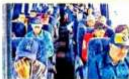
MAR 9. Habitantes de Jerez expulsados por la narcoviolencia viajan a CDMX en busca de reunirse con el Presidente Andrés Manuel López Obrador.