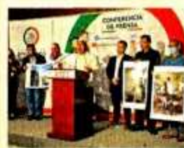
MAR 10. Desplazados de Jerez y Valparaíso acuden a la Cámara de Diputados para denunciar el hostigamiento de criminales.