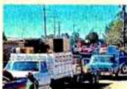
FEB 20. Un primer grupo de desplazados de Palmas Altas vuelve a sus viviendas para empacar lo que pudiera e irse de la zona.

La violenta disputa entre el CJNG y el Cártel de Sinaloa por el control de Zacatecas ha generado múltiples desplazamientos de habitantes en Jerez y Valparaíso.