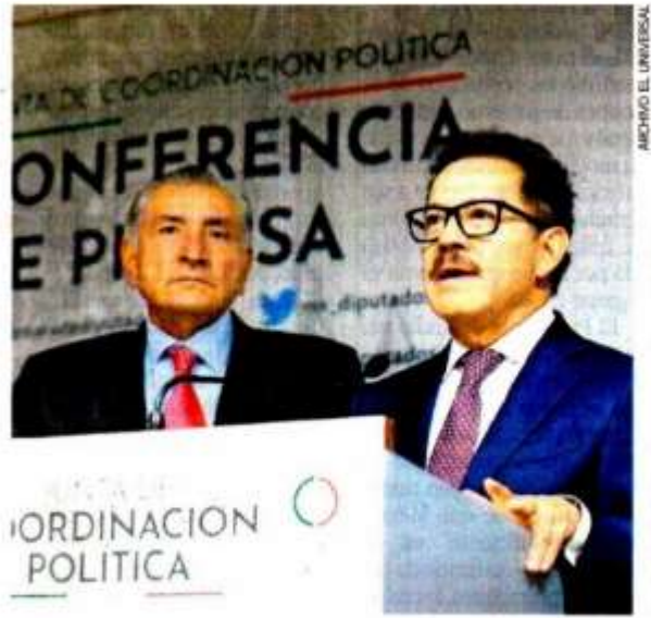
Hace unos días, el secretario Adán Augusto López se reunió con diputados, con quienes acordó una pausa en el tema de cabotaje.