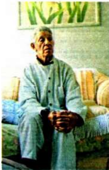
Gráfico: Daniel Rey