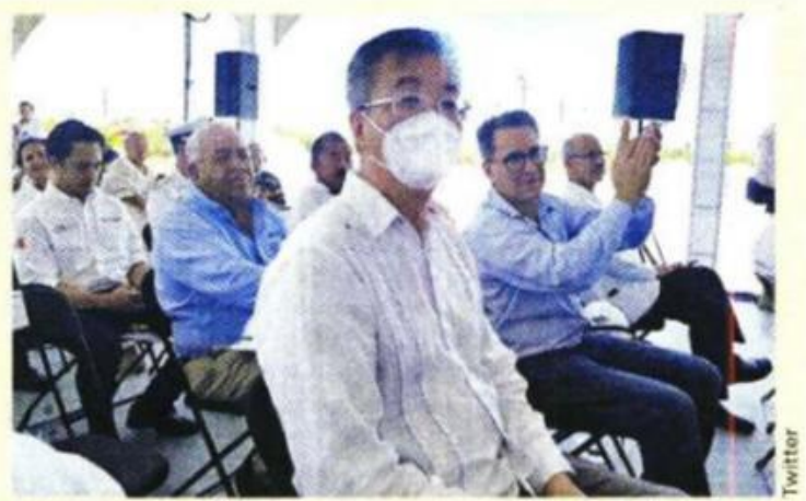
Zhu Qingqiao, Embajador de China en México.

// Quiero hacer un reconocimiento, un homenaje al empresario más austero y más institucional de México, que es también nuestro orgullo, Carlos Slim, que nos acompaña”.