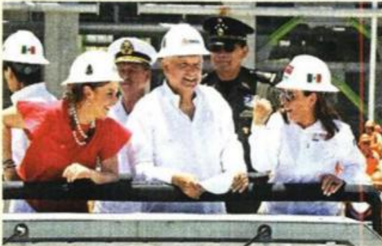
Gobierno de México

Funcionarios públicos, representantes de la iniciativa privada y diplomáticos asistieron al corte de listón