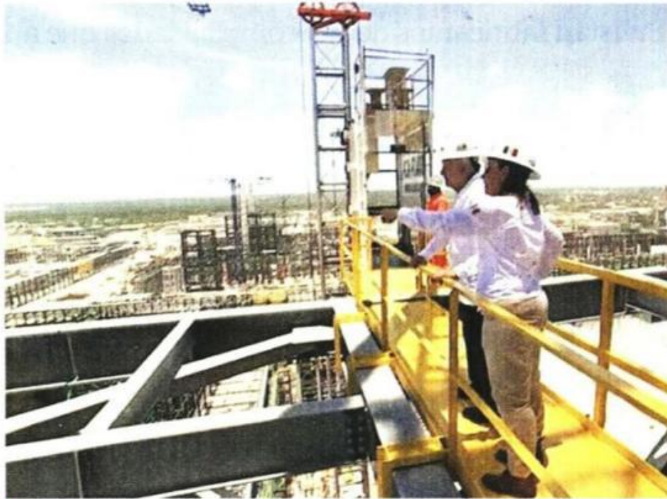
El Presidente López Obrador hizo un recorrido por las instalaciones de la refinería.