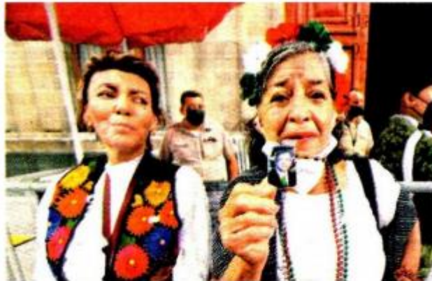
Simpatizante con una fotografía del mandatario.

Así, tras el arribo de los simios trajeados y del Presidente en el pecho de los morenistas, se entregó el cuarto Informe de gobierno. ■