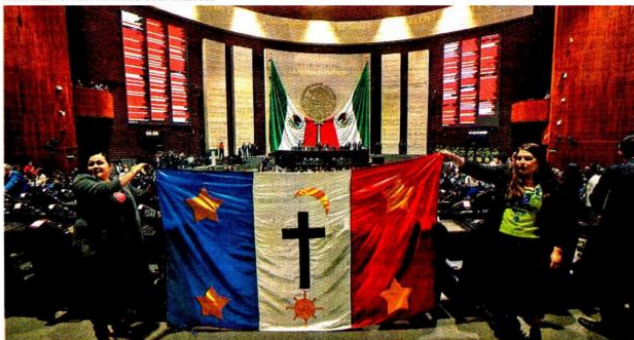
Diputadas mostraron la bandera de los pueblos yaquis antes de la sesión en el recinto legislativo. ARACELI LÓPEZ