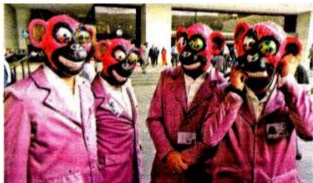
Activistas vestidos de simios. OCTAVIO HOYOS