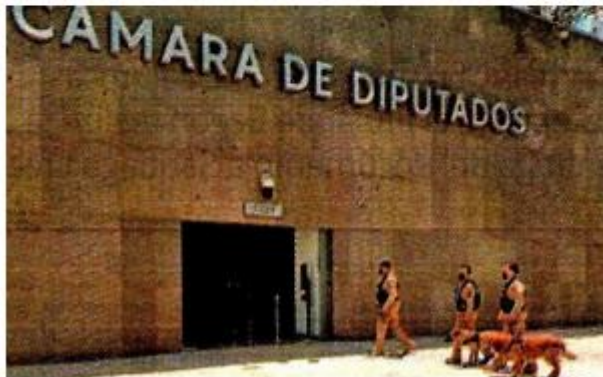
Operativo previo a la sesión del Congreso.