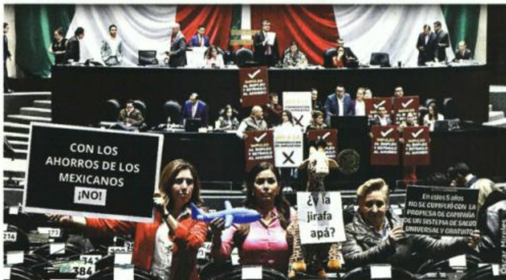
■ Durante la maratónica sesión de más de 15 horas abundaron las tomas de tribuna.

la que aumentó el impuesto. La próxima vez que vayas al súper te pido que recuerdes que te pidieron un esfuerzo extra”, resaltó.