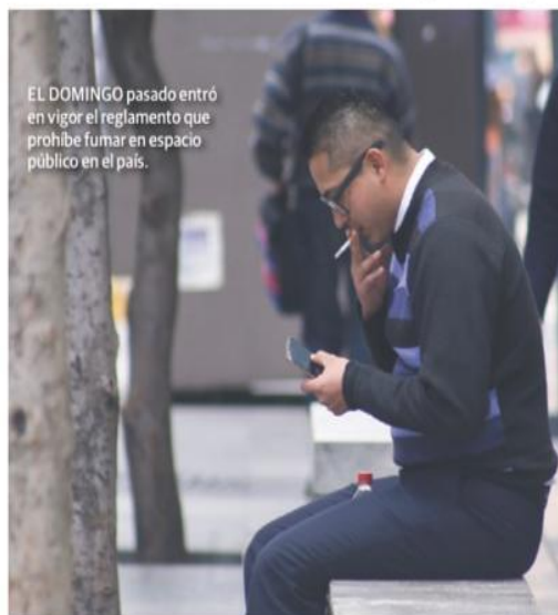
EL DOMINGO pasado entró en vigor el reglamento que prohíbe fumar en espacio público en el país.

NUEVAS MEDIDAS para el control de cigarrillos evitarán 290 mil nuevos casos de enfermedades asociadas a este hábito; en Guanajuato se implementa estrategia de prevención