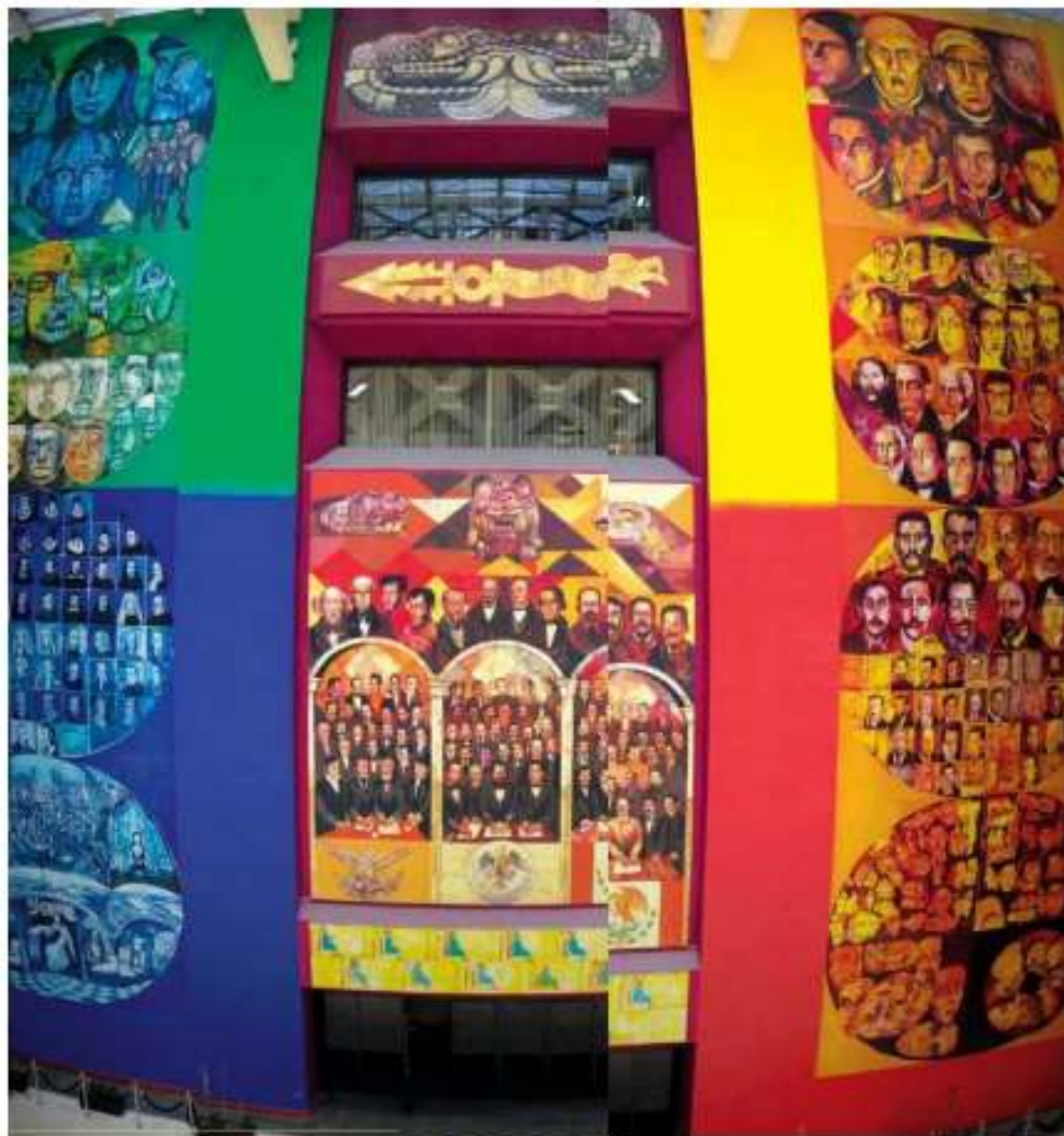
OBRAS. El recinto de San Lázaro, proyectado por Pedro Ramírez Vázquez, cuenta con múltiples murales.