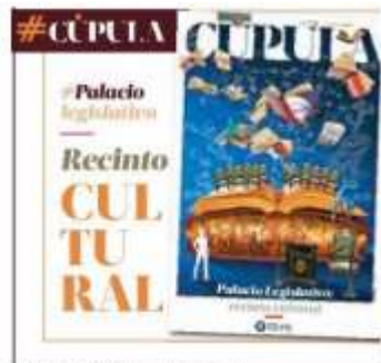
ILUSTRACIÓN: GUSTAVO A. ORTIZ