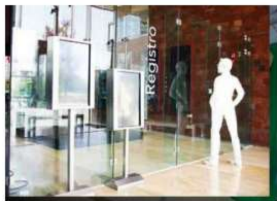
EXHIBICIÓN. El Museo Legislativo Sentimientos de la Nación fue reinaugurado en 2019.