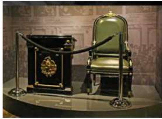
MEMORIA. Objetos que forman parte de la historia de México se exhiben en el espacio.