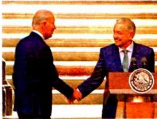
Biden y AMLO, en la Cumbre de las Américas

“No fue posible localizar archivos que documenten recursos recibidos por parte del gobierno de Estados Unidos durante ese periodo”