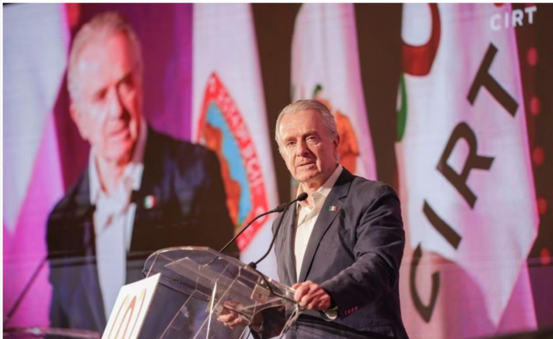
Aspirante presidencial Santiago Creel en la 96 Convención Nacional de la Cámara Nacional de la Industria de Radio y Televisión (CIRT).

NACIÓN | 20/06/2023 | 05:33 | Santiago Creel | Actualizada 05:33