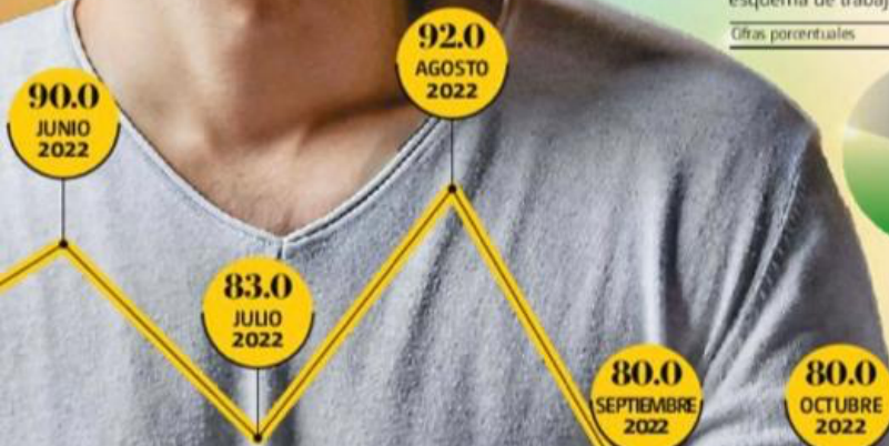
Se encendieron las alertas empresariales ante las renuncias.