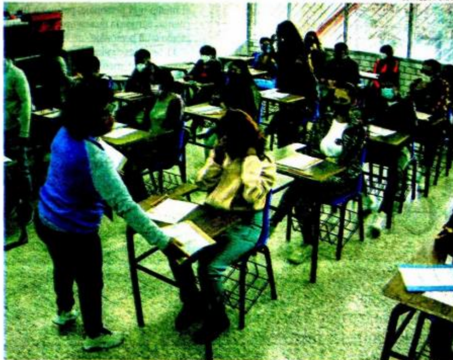
Gráfico: Daniel Rey