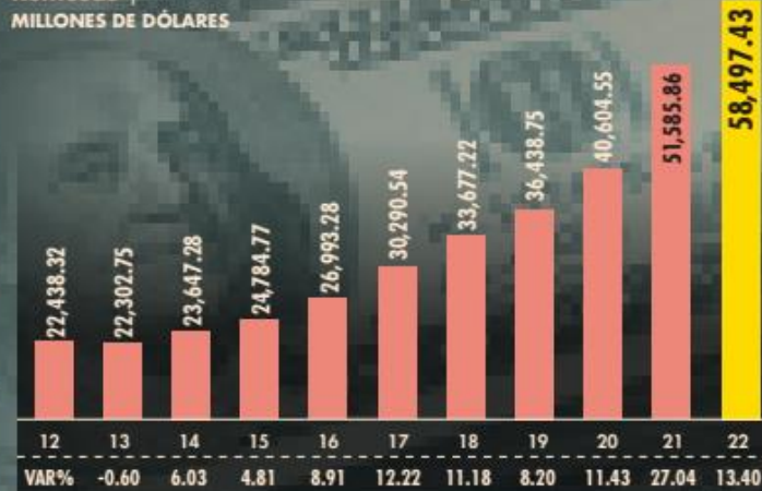
Remesas | MILLONES DE DÓLARES

El monto de las remesas a México en el 2022 creció a doble dígito por tercer año al hilo y se triplicó en los últimos 11 años. El monto se debió en parte al crecimiento de la masa salarial de mexicanos en el mercado de EU.