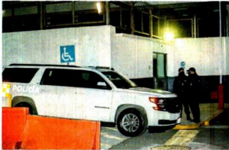
Las indagatorias corresponden a servidores públicos de la FGR, incluyendo agentes del Ministerio Público de la Federación, peritos y policías federales ministeriales.