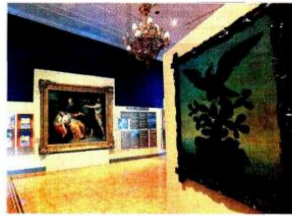
Por el indiscutible valor cultural se llevaron a cabo obras de renovación en la totalidad del Recinto Parlamentario.