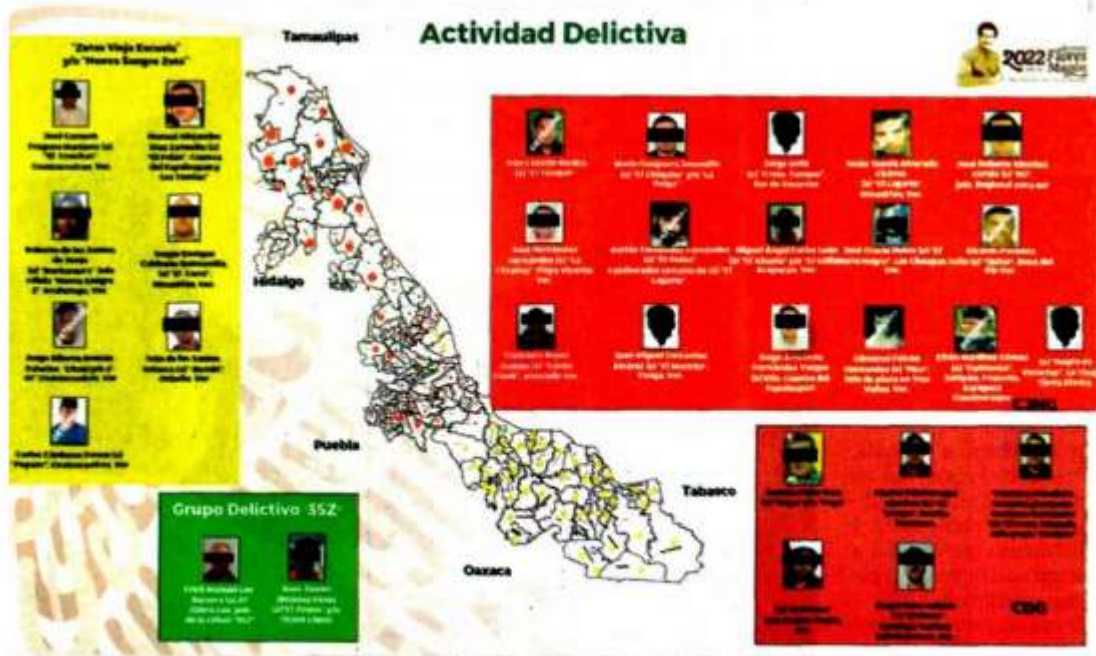
Informes de la Sedena detallan las zonas de los grupos delictivos y el seguimiento que llevan de sus miembros.