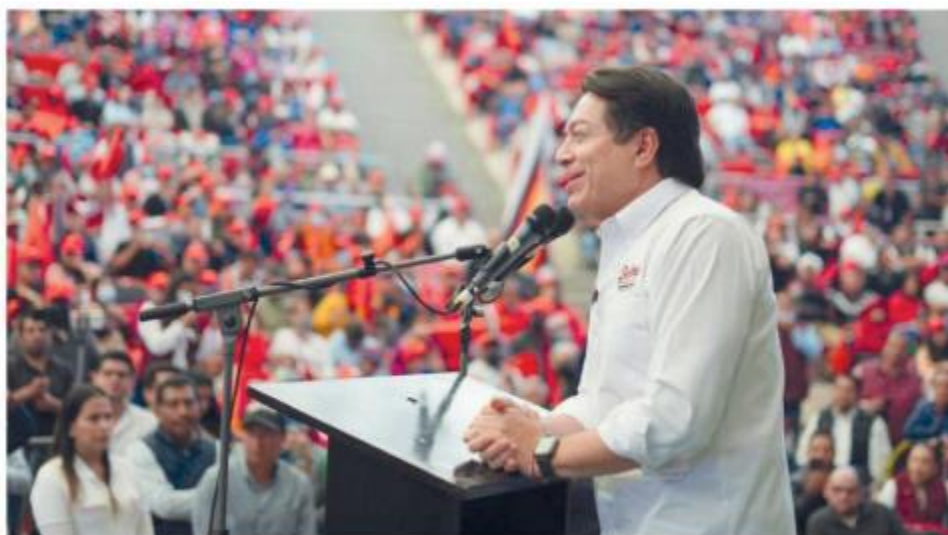
Mario Delgado reconoció la labor de los diputados y senadores de Morena, PVEM y PT.

Por ello, destacó el “legado” que dejará esta generación de legisladores, pues a través de la aprobación de leyes y políticas públicas se está sentado una base para alcanzar un “México más justo, democrático, igualitario, incluyente, pacífico y regido por la voluntad popular”. •