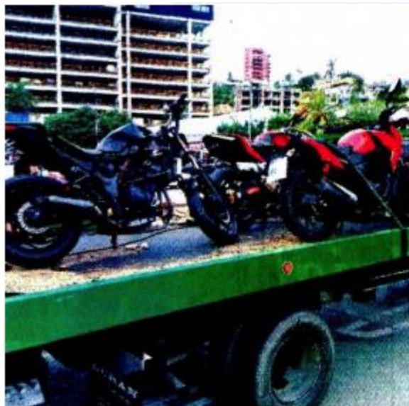
El traslado de motocicletas a corralones son una constante.