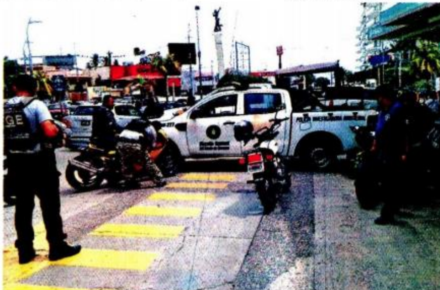
Pese a los operativos para detectar motos irregulares, la ciudadanía se niega a regularizarlas.

están abandonadas en el corralón de Irapuato, debido a algunas irregularidades.